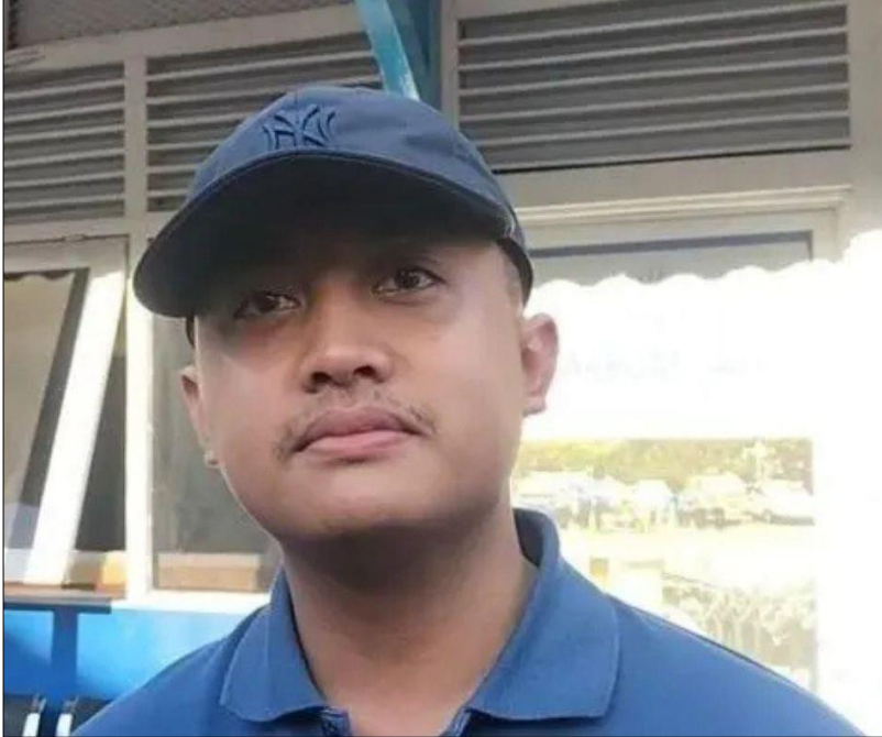
Putra Mahkota Keraton Solo, KGPA Hamengkunegoro, menjadi sorotan menyusul unggahannya di media sosial

Solo, Dekade – Putra Mahkota Keraton Solo mengkritik pemerintah pusat melalui unggahan di medsos. Kata-kata 'Nyesel gabung Republik' yang dilontarkannya menjadi sorotan saat narasi 'Indonesia Gelap' masih bergulir.